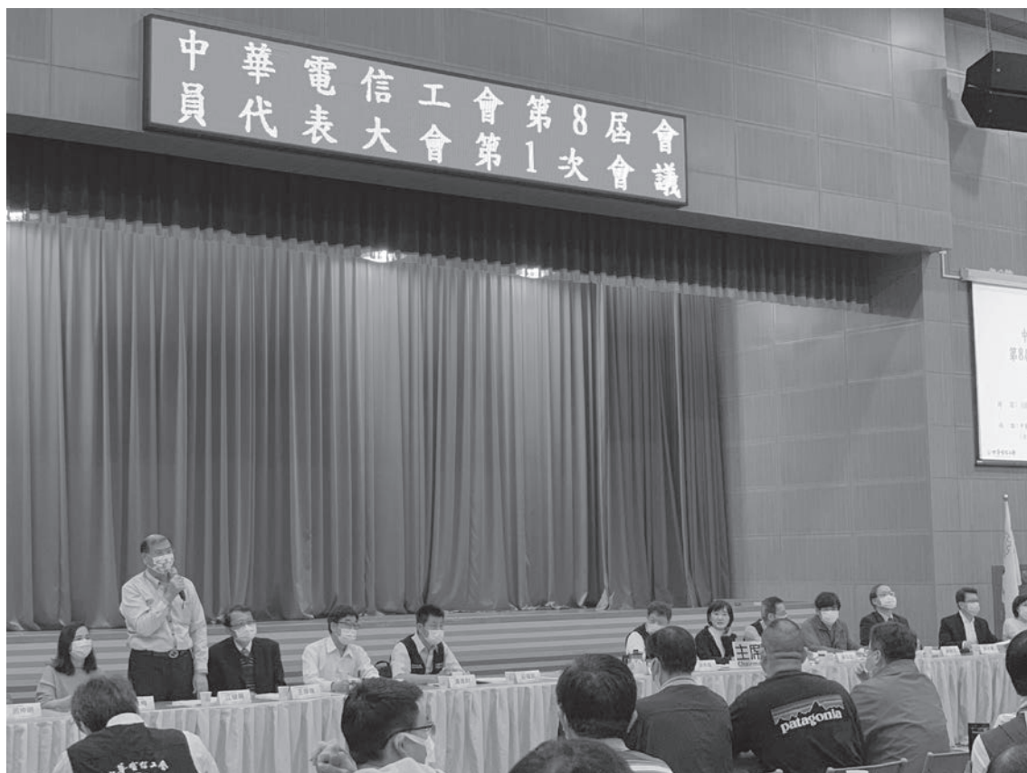
▲ 2021.3.4 江理事長出席中華電信工會第8屆會員代表大會第1次會議