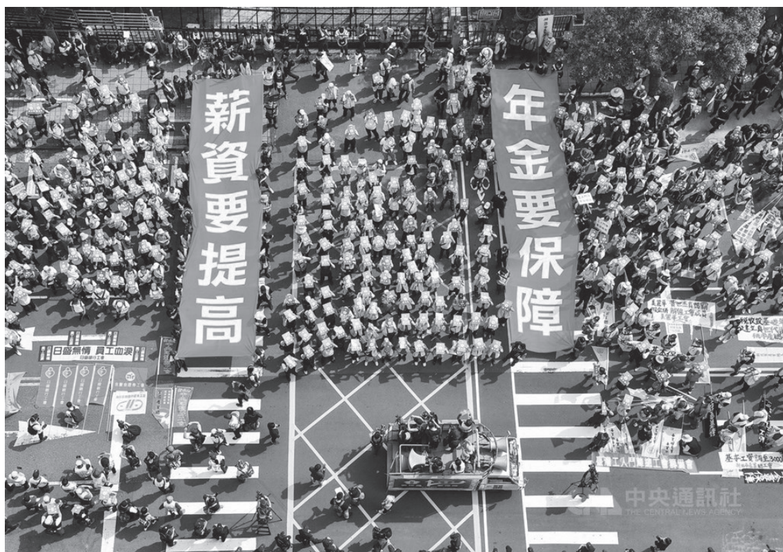
▲ 一年一度的勞工大遊行1日中午登場，今年活動號召逾3000人參與，民眾在立法院前拉開「薪資要提高」、「年金要保障」布條，表達期待立院「最低工資法」、「勞保年金改善方案」儘速審議通過的訴求。110年5月1日

勞工大遊行今天中午在凱道集結後，下午近3時宣布解散，現場有逾3000人參與，訴求「薪資提高、年金保障」，遊行隊伍先後至立法院及監察院，要求政府重視低薪及勞保年金問題。