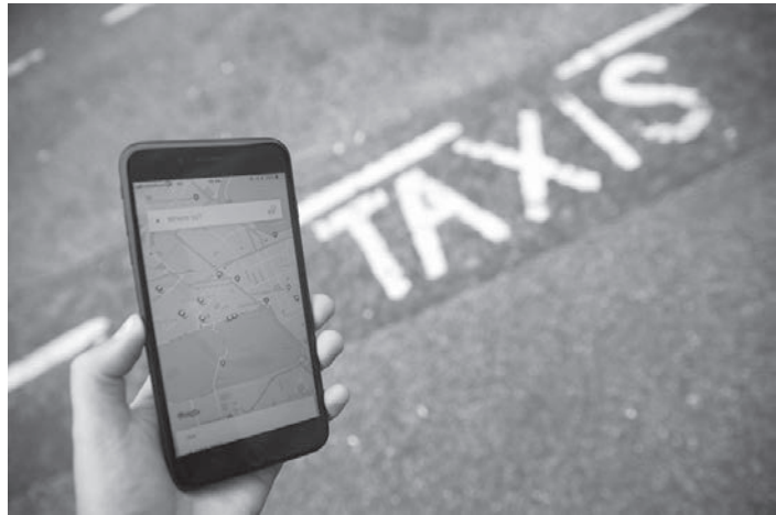
▲ 倫敦街頭uber app畫面。

該案件將會回到雇傭審判 (employment tribunal)，決定補償金額。代表 2000 位提起訴訟的 uber 司機的律師事務所表示每人可能可以拿到 12000 鎊 (約 46 萬台